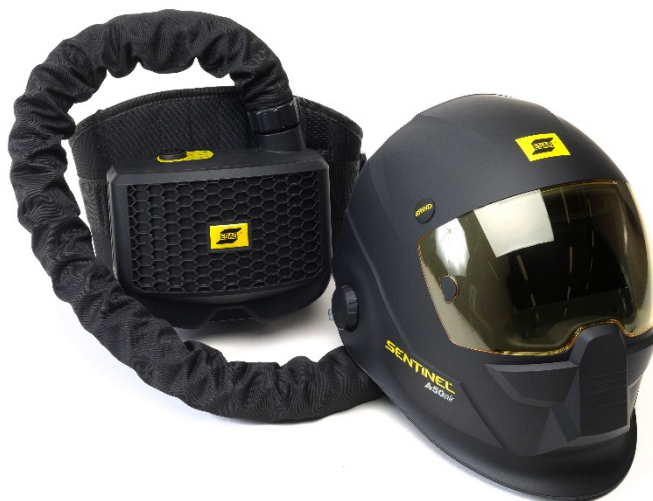
SENTINEL A50 Air z urządzeniem ESAB PAPP